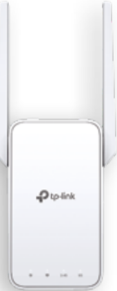
REPETIDOR TP LINK AC1200 WiFi /Doble Banda