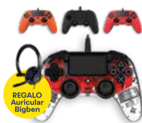
REGALO Auricular Bigben 39'99€ NACON PACK DE MANDO + AURICULAR