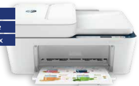
IMPRESORA MULTIFUNCIÓN HP 4130E

Incluye 6 meses de Impresión HP Instant Ink (ver condiciones en www.hp.com).