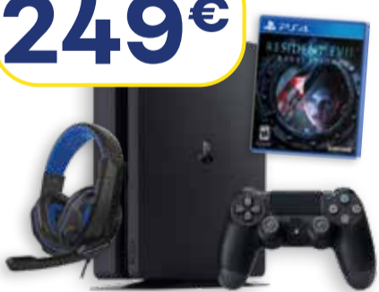
SONY PS4 CONSOLA + JUEGO + AURICULARES PS4 500 GB.